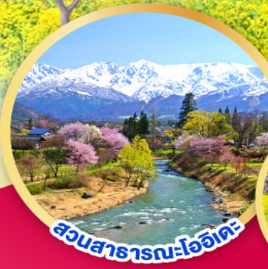
สวนสาธารณะโออิตะ