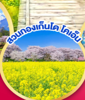
สวนทองกั้นโด ไคเอ็น